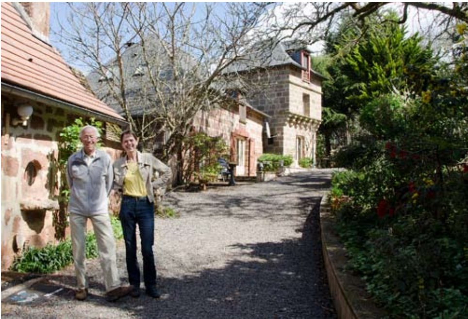
De gelukkige eigenaars van een prachtig arboretum

harte welkom. Alles is goed geëtiketteerd en gemakkelijk begaanbaar over graspaden. Het ietwat glooiende terrein maakt het verrassend om rond te wandelen en steeds weer andere uitzichten over de bomencollectie te ervaren. Er staan momenteel meer dan 1500 verschillende taxa loof- en naaldbomen aangeplant. Naast de dendrologische collectie kan men ook genieten van kunst en kitsch en van een groep gezellige kippen die vrij rondscharrelen, eenden, ganzen en bevervatten (vriendelijke herbivoren) die de vijvers bevolken en allerlei zang- en roofvogels die het arboretum als hun woonplaats hebben gekozen. De reeën en wilde zwijnen zijn minder welkom maar komen ongevraagd soms toch langs. Vooral reeën veroorzaken veel schade aan de jonge aanplant (vraat- en veegschade).