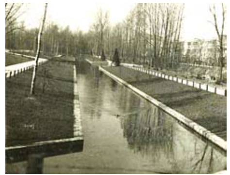
De vijverpartij dateert van rond 1941

leg, maar Doorenbos blijft de grote inspirator. Hoe zullen we het noemen? Het Ridderlaanplantsoen? Het Doorenbosplantsoen?