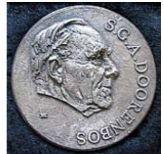
Afbeelding van de S.G.A. Doorenbospenning (in zilver en in brons) waarmee de NDV de verdiensten van dendrologen eert

Een moedig mens, die Doorenbos! Tijdens zijn schorsing, later gevolgd door ontslag, verrichtte Doorenbos veel voorbereidend werk voor de wederopbouw van Den Haag na de bevrijding. Op 7 mei 1945 werd hij in zijn oude functie hersteld. 1